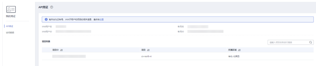
图 7-1 查看项目 ID