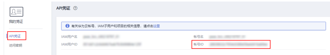
图 4-2 获取账号 ID