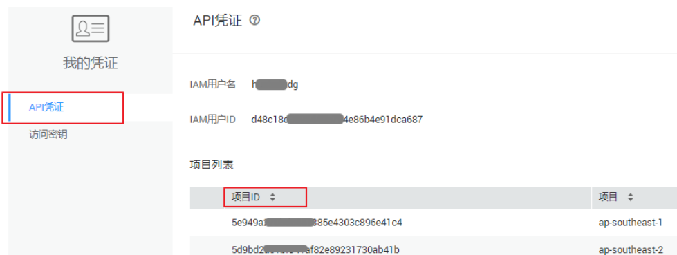
图 4-1 查看项目 ID