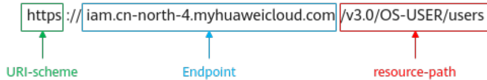
图 3-1 URI 示意图

https://iam.cn-north-4.myhuaweicloud.com/v3.0/OS-USER/users