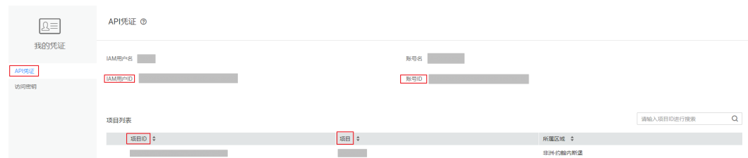
图 6-1 查看项目 ID