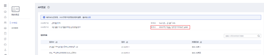
图 7-1 获取账号 ID