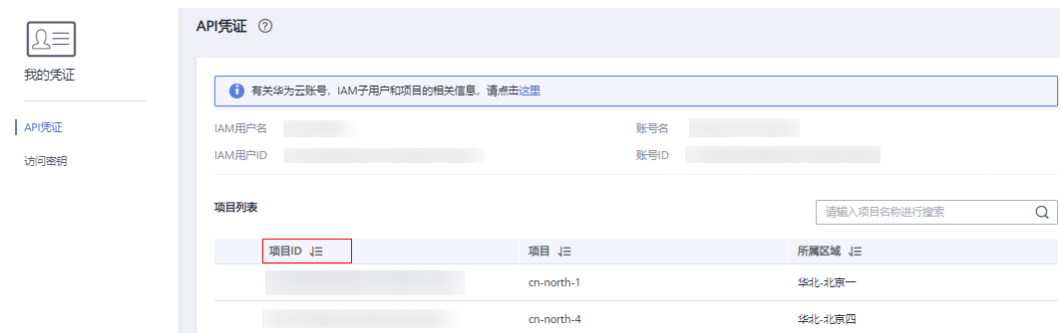
图 6-1 查看项目 ID