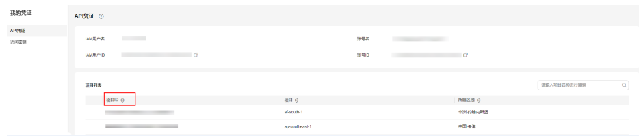
图 7-1 查看项目 ID