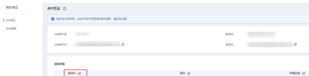
图 A-1 查看项目 ID