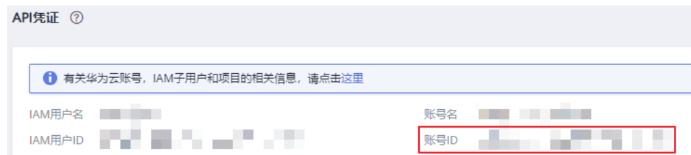
图 A-2 获取账号 ID