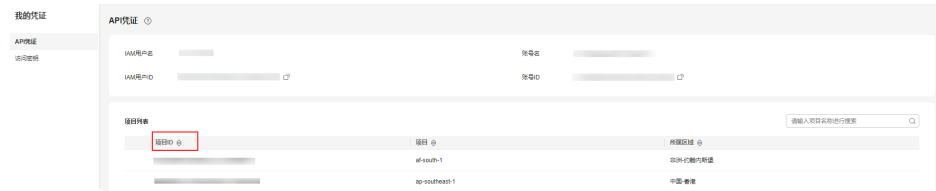
图 A-1 查看项目 ID