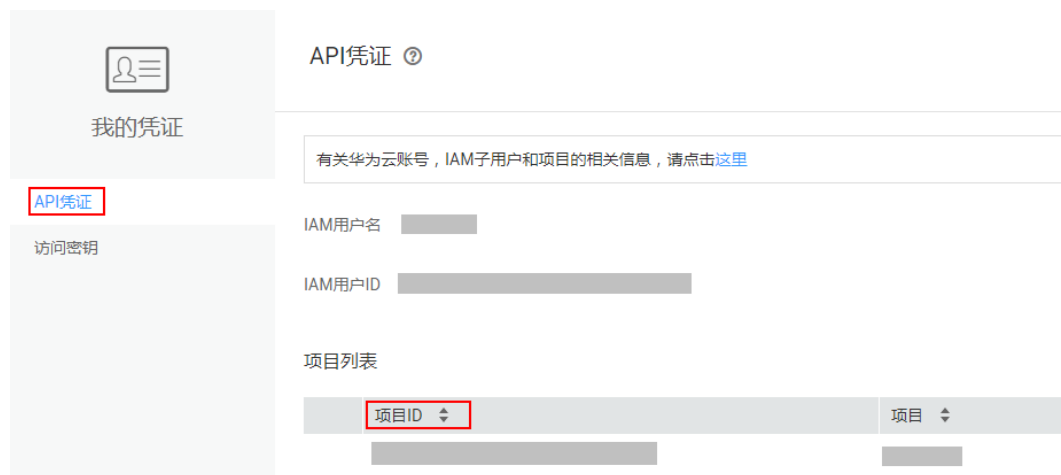
图 6-1 查看项目 ID