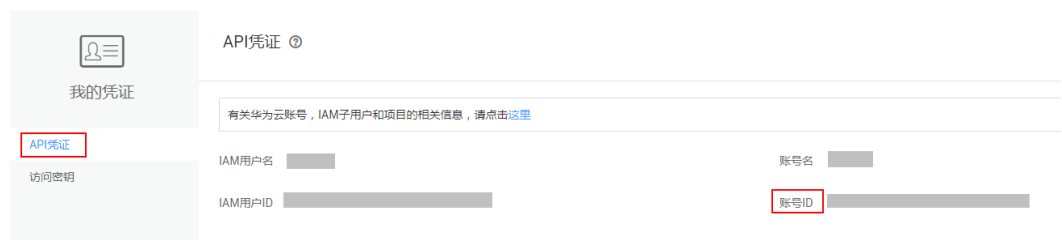
图 6-2 获取账号 ID